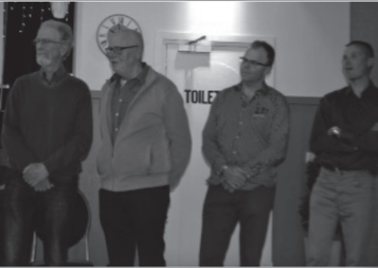
Foto-samenvatting ALV 2019